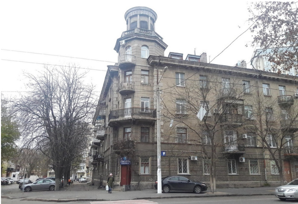
Дом на Спиридоновской, 26, где было здание школы Талмуд-Тора

Слушатели были внимательны и сосредоточенны. Но иногда, в самом душевном месте... открывалась калитка, и из нее выходил убеленный сединами старец — это был знаменитый писатель Менделе Мойхер-Сфорим. Он шел прямо ко мне. Сквозь толстые стекла очков я видел ироничные улыбающиеся глаза. Ласковым старческим голосом он говорил: — Молодой человек, не могли бы вы найти другой концертный зал для выступлений? — Я умолкал, а величественный старец так же неторопливо удалялся».