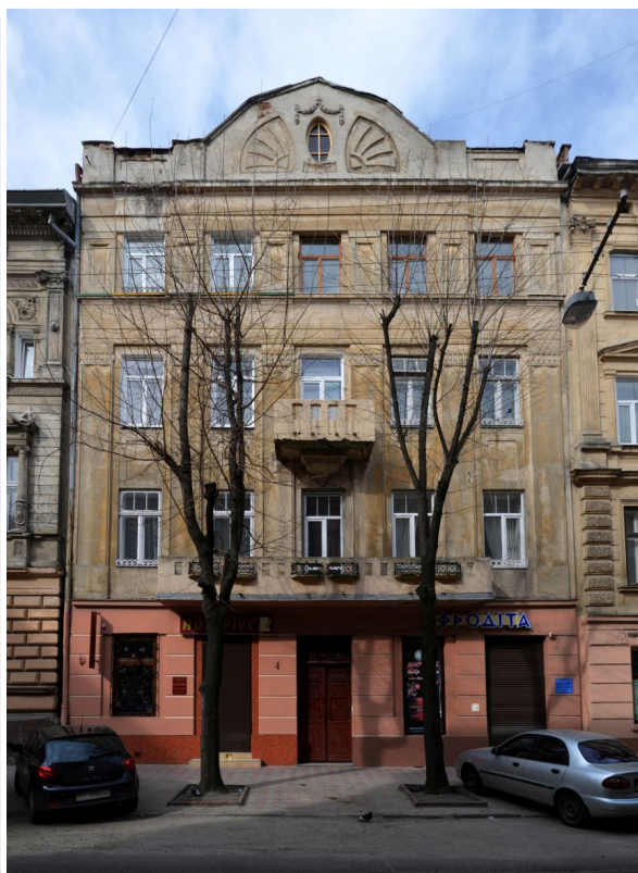
Львовский дом, где прошло детство писателя (ул. Б. Лепкого, 4)