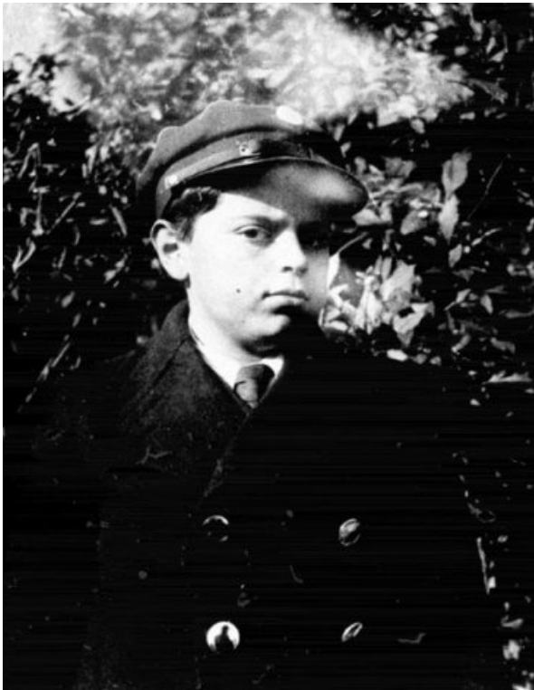
Станислав Лем, 1934