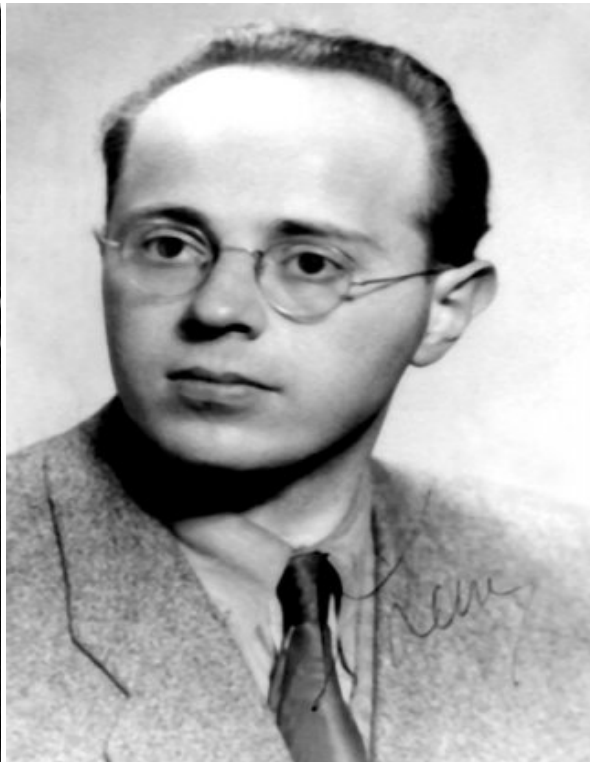
Лем в послевоенной Польше, 1947