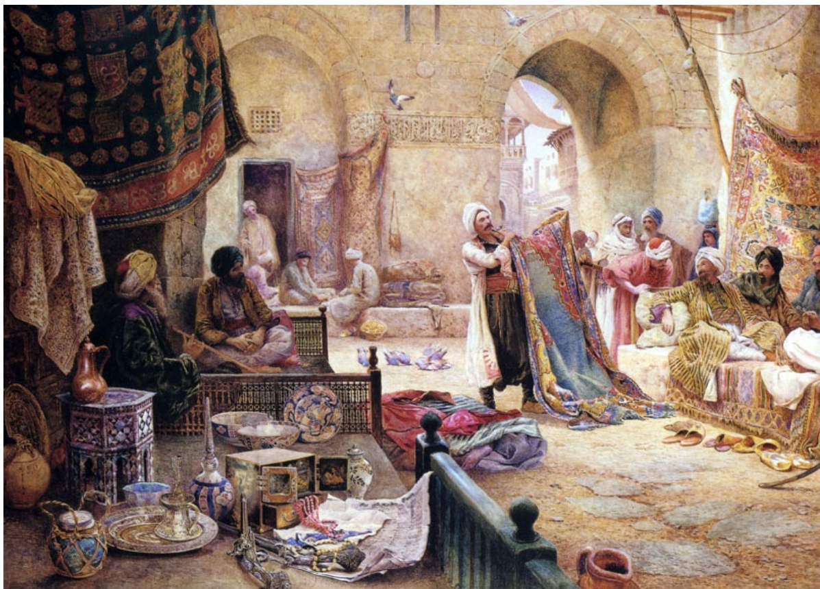
«На рынке ковров», худ. Ч. Робертсон, фрагмент

Спустя века, во времена позднего Рима, появляется реклама товаров, услуг постоянных дворов, учителей, агитация за кандидатов на муниципальных выборах, реклама гладиаторских боев и общественных увеселений. Все это стало известно по надписям, этикеткам, мозаикам, стенным росписям и вывескам лавок в Риме, Помпеях и некоторых провинциях.