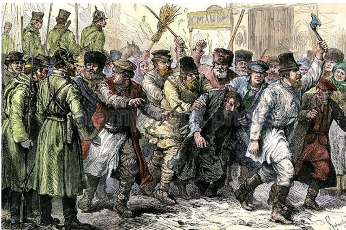
Киевский погром, апрель 1881