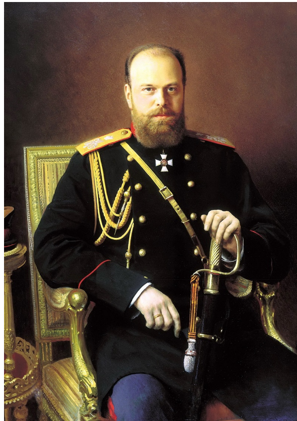
«Александр III», худ. И. Крамской, 1886