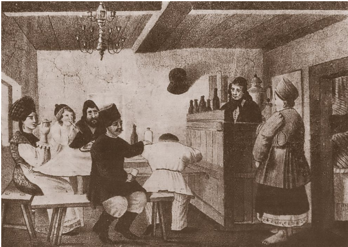
«В корчме», 1843

Особенно раздражало монархическую прессу желание евреев защитить себя и свое имущество. В Бердичеве, например, после безрезультатного обращения к властям с просьбой об отправке войск для предотвращения погрома, местная община создала самооборону.