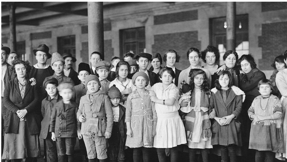
Дети еврейских иммигрантов, Нью-Йорк, нач. XX века

В «Рассвете» писатель Моше Лейб Лилиенблюм, напротив, подкрепляет идею о переселении в Палестину тем, что евреи всегда и везде — в Испании, Польше, Франции — считались чужими, другими. И если решаться на эмиграцию, то в пользу исторической родины.