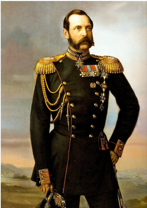
Парадный портрет Александра II

Что касается новых законов, призванных разрешить еврейский вопрос, то стоило бы, как замечает один из авторов «Русского Еврея», пригласить на суд самих овец. Этого, как мы знаем, не произошло, и в мае 1882 года были приняты так называемые Временные правила, резко ограничивавшие права евреев, запрещавшие им селиться в сельской местности, приобретать недвижимое имущество вне местечек, арендовать земельные угодья и т.д.