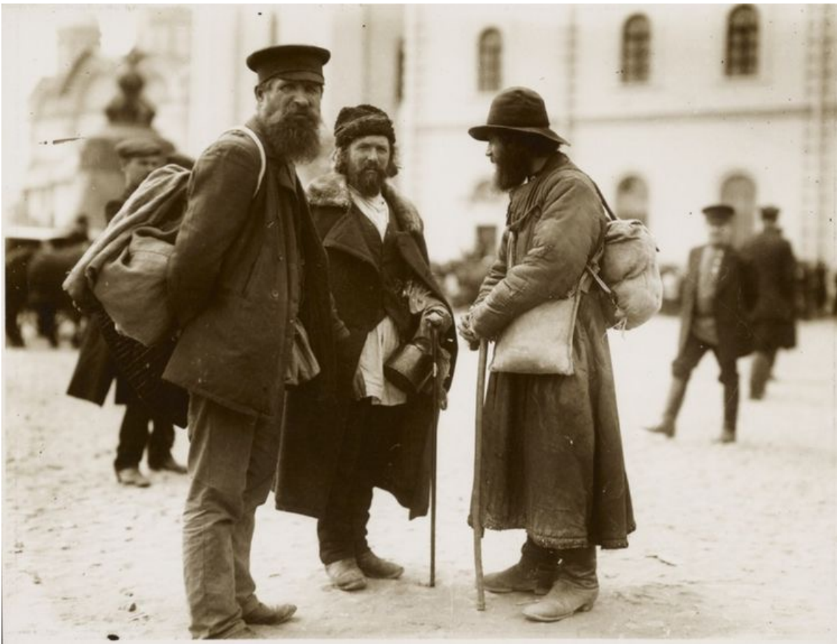
Евреи черты оседлости

Семитическая раса, при всех своих способностях, обладает многими качествами, которые делают ее малосимпатичною для русского человека, вообще не отличающегося племенной нетерпимостью и относящегося добродушно к другим расам. Еврей не потому, что он еврей, приводит, как видим, в раздражение русского человека, но потому, что в евреях, где их много, русский человек видит враждебное начало для своего экономического благосостояния.