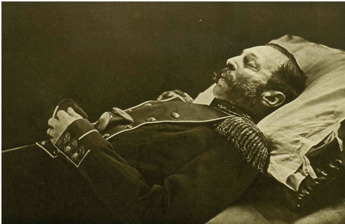
Император Александр II на смертном одре