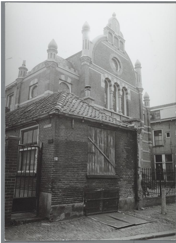
Синагога в 1930-е годы