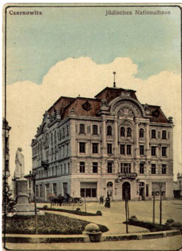
Еврейский народный дом

Улица Бенно Штраухера и целых три (!) переулка имени многолетнего главы еврейской общины Черновцов и депутата австрийского парламента появятся в столице Буковины.