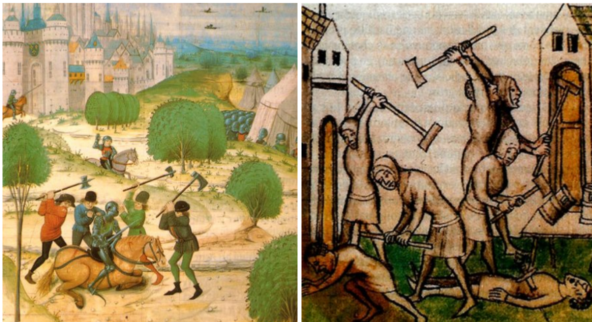
Налоговый бунт, известный как Восстание молотобойцев, Франция, XIV век

Лишь на рубеже XVII — XVIII веков после многочисленных налоговых бунтов в Европе начинали переходить к более простой, понятной и стабильной налоговой системе. Тем не менее выработка единых норм и стандартов оценки оказалась очень длительным процессом, и лишь в 1868 году оценщики Англии впервые в мире объединились в некий профсоюз.