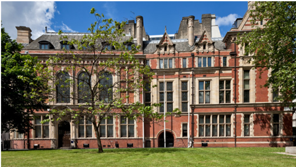
Королевский институт дипломированных оценщиков, Лондон

Вторую часть этой главы можно назвать «Введением в основы экономической оценки», где нам предлагается правильная логика оценки. Критерии оценки должны существовать абсолютно для всего, а сама оценка обеспечивать исключительно нужды рынка и не зависеть от государства. Почему же понадобились тысячи лет, море крови, пролитой при налоговых бунтах, чтобы люди пришли, наконец, к единым критериям оценки? Ведь правильное поведение при оценке приводится уже в Торе.