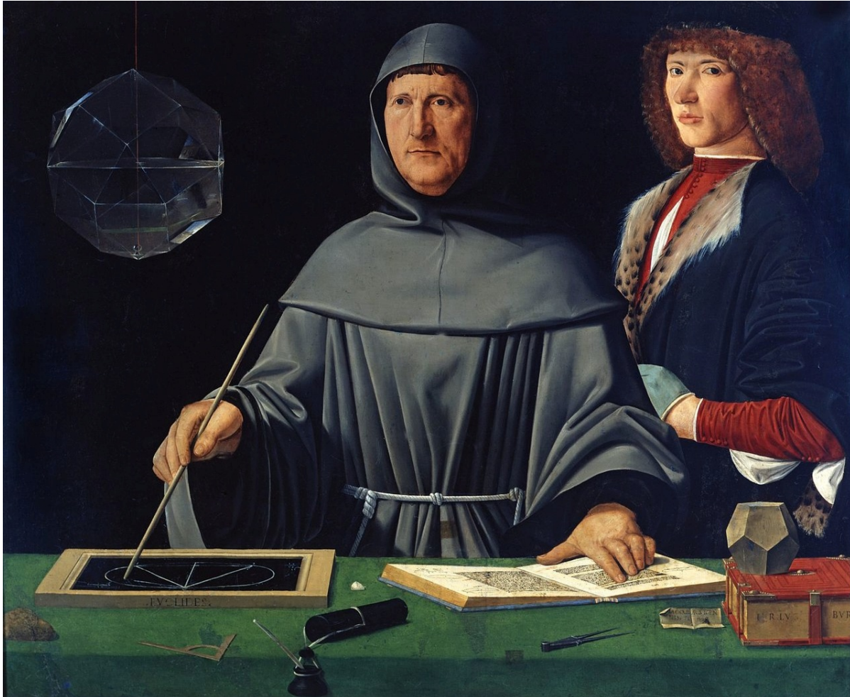
Портрет Луки Пачоли, худ. Якопо де Барбари, 1495

Высшая ловкость состоит в том, чтобы всему знать истинную цену