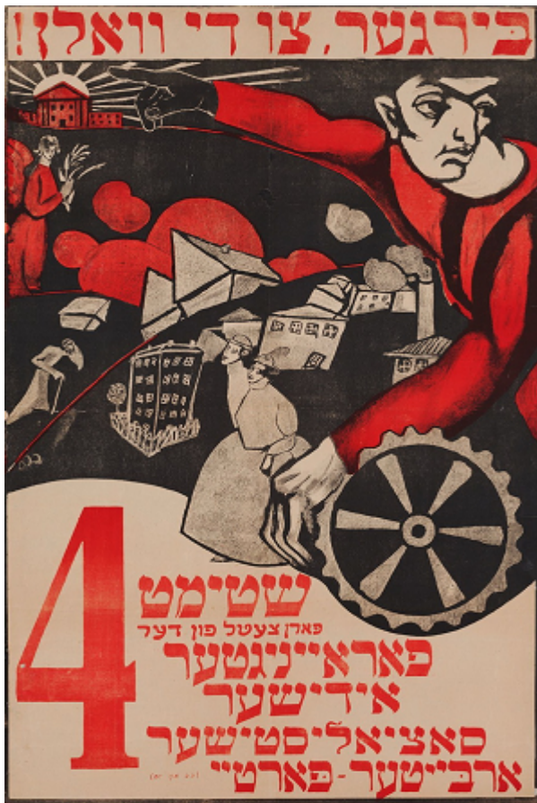
Голосуйте за Объединенную еврейскую социалистическую рабочую партию, плакат, 1917