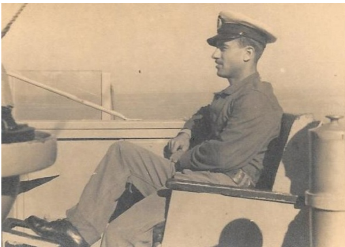
Элиягу в 1951 году

Недавно на встрече в Тель-Авиве 88-летней Рика рассказал об этой операции. «День, выбранный для ее проведения — 29 ноября 1948 года был приурочен к годовщине резолюции ООН о разделе Палестины, ко дню победы еврейского народа над Гитлером», — вспоминает ветеран.