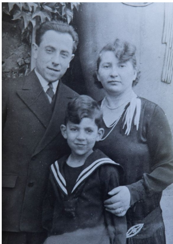
Генри с родителями до войны

В этот день Генри привезли в Маутхаузен. Он голодал и страдал от диареи, и когда 5 мая 1945 года американцы освободили лагерь, заключенный В3407 весил меньше 40 кг.