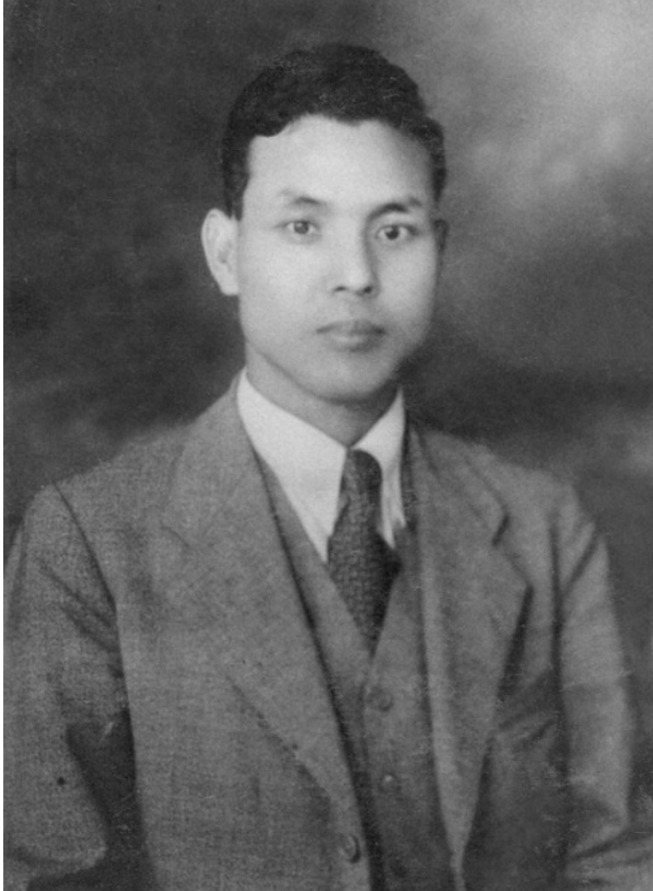
Сабуро Нэи в 1930-е

Китаде. Он знал, что документы, найденные в Москве, указывают на выдачу японских транзитных виз еврейским беженцам, следовавшим через Владивосток. Но ни одной подобной визы не было найдено, пока коллега Китаде из Филадельфии не сообщил ему, что обнаружил документ на японском языке, который не в состоянии прочесть. Как только журналист увидел имя на пожелтевшей бумаге, то понял, что это одна из виз, выданная Сабуро Нэи.