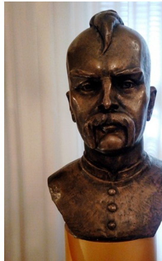
Бюст полковника Нечая

Вероятно, легенда о семи могилах родилась среди евреев Сатанова, для которых семь курганов у Гусыковой горы символизировали семь могил-алтарей Ханны. Этому способствовали и представления о полковнике Нечае как современном воплощении кровавого Антиоха Эпифана. Впоследствии эта легенда перешла в фольклор живущих рядом христиан. Тем более, что к Нечаю в Сатанове не питали особой любви ни иудеи, ни католики, ни униаты, ни православные.