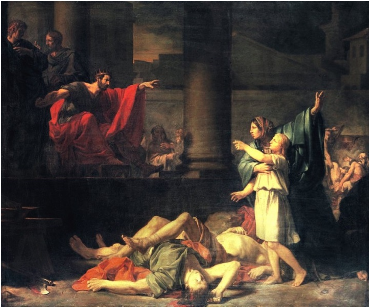
Ханна и семь ее сыновей