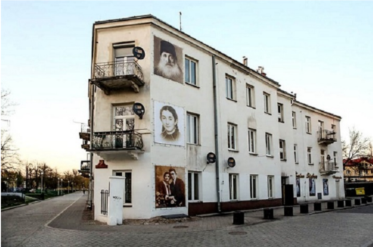
Дом №7 на улице Планта с фотографиями убитых здесь евреев, Кельце, 2000-е годы

В свидетельствах, написанных на разных языках, звучат похожие зловещие истории о возвращении евреев в родные края. От Киева до Праги звучал вопрос удивленных соседей: «Ты что, жив?» или страшная фраза о «незаконченной работе Гитлера».