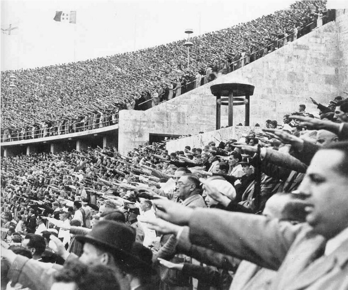
На олимпийском стадионе, Берлин, 1936

В конце 1920-х претендентов на проведение XI летних Олимпийских игр было предостаточно, но выбор Международного олимпийского комитета (МОК) пал на Берлин. Аргументы: возвращение Германии в мировое сообщество после поражения в Первой мировой; в Берлине должна была пройти Олимпиада-1916, отмененная из-за войны.