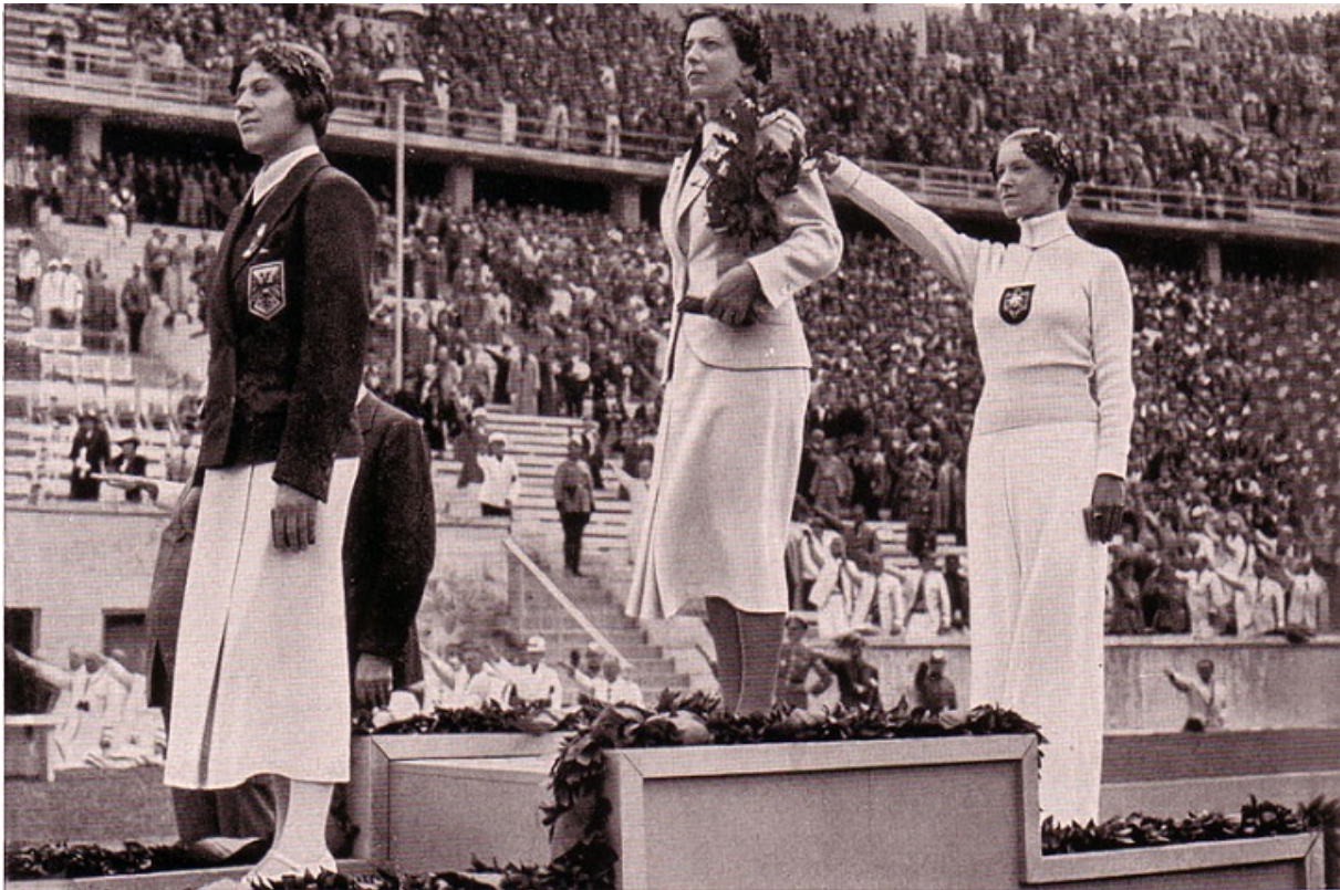
Награждение фехтовальщиц. Крайняя справа - Хелена Майер

Опасаясь негативной международной реакции, Гитлер все же допустил на олимпиаду одну полуеврейку — лучшую немецкую фехтовальщицу, блондинку Хелену Майер, чемпионку Олимпиады-1928. В 1933-м Геббельс охарактеризовал ее как «истинный образец нордической женственности». А затем выяснилось, что ее отец — еврей. Девушку исключили из фехтовального клуба, но Майер не считала себя еврейкой и согласилась выступить за немецкую олимпийскую команду.