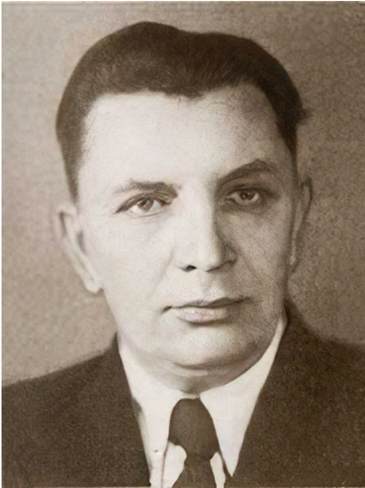
Министр госбезопасности Семен Игнатьев

Во время войны работала по специальности на авиационном заводе № 4, а с 1944 года по совместительству — в Госстрахе. В 1948 году она вышла на пенсию, но работу не бросила: по-прежнему лечила людей.