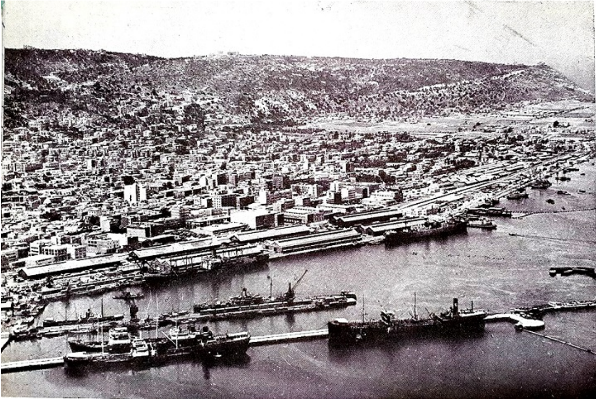
Порт Хайфы, 1950-е