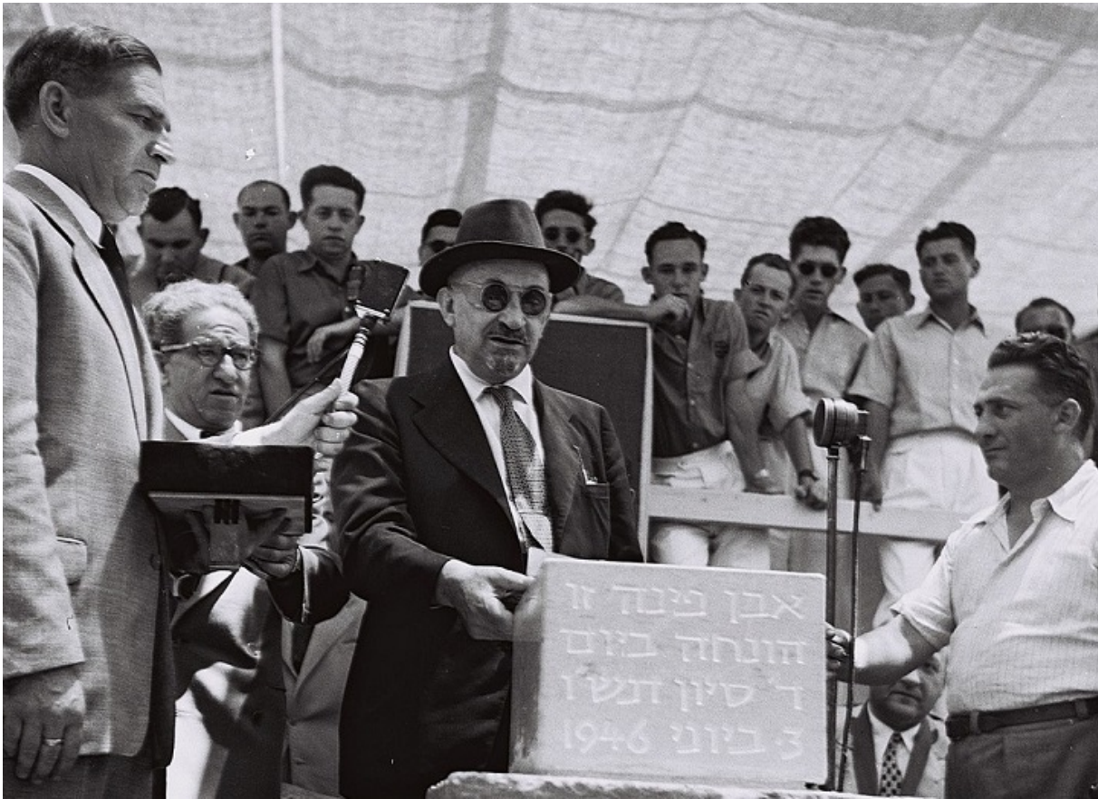
Хаим Вейцман закладывает краеугольный камень в основание будущего научно-исследовательского института своего имени, 1946