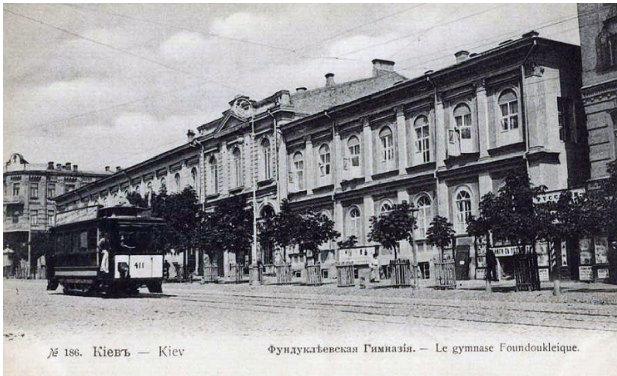
Фундуклеевская женская гимназия