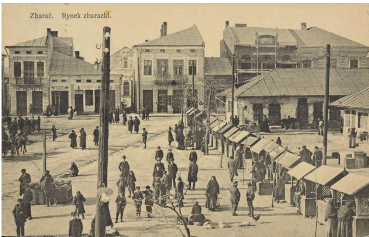
На рыночной площади Збаража.